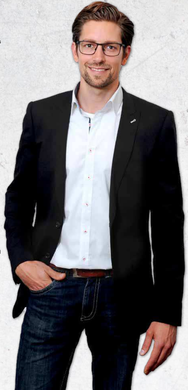
FOTO KELLER Fischemäkerstraße 9 Ihre Bilderfamilie aus Goslar 38640 Goslar www.bilderfamilie.de

Ein ganz großes Dankeschön an unsere Models, an das Fotostudio Keller und an die Visagistin Joanna Andrusch (j.andrusch-makeupartist@web.de) fürs Mitmachen, die tollen Fotos und das super Styling!